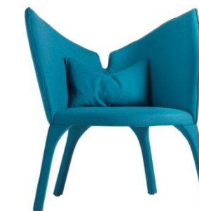
Fauteuil - Armchair - Sillón