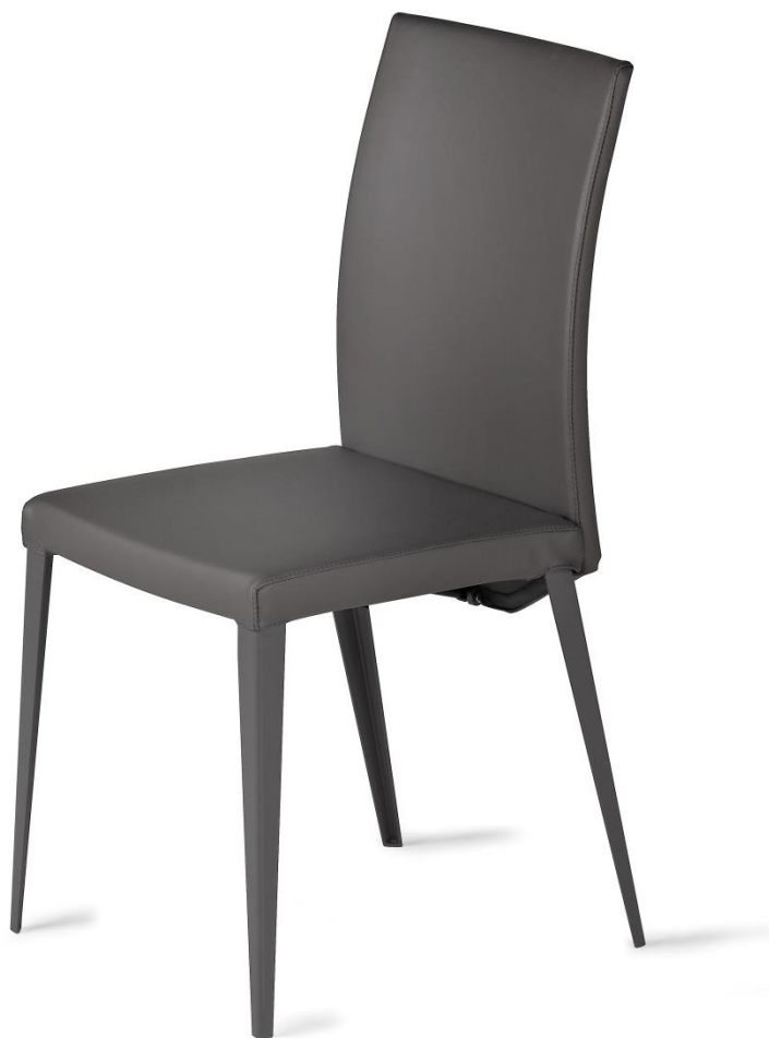
Chaise - Chair - Silla