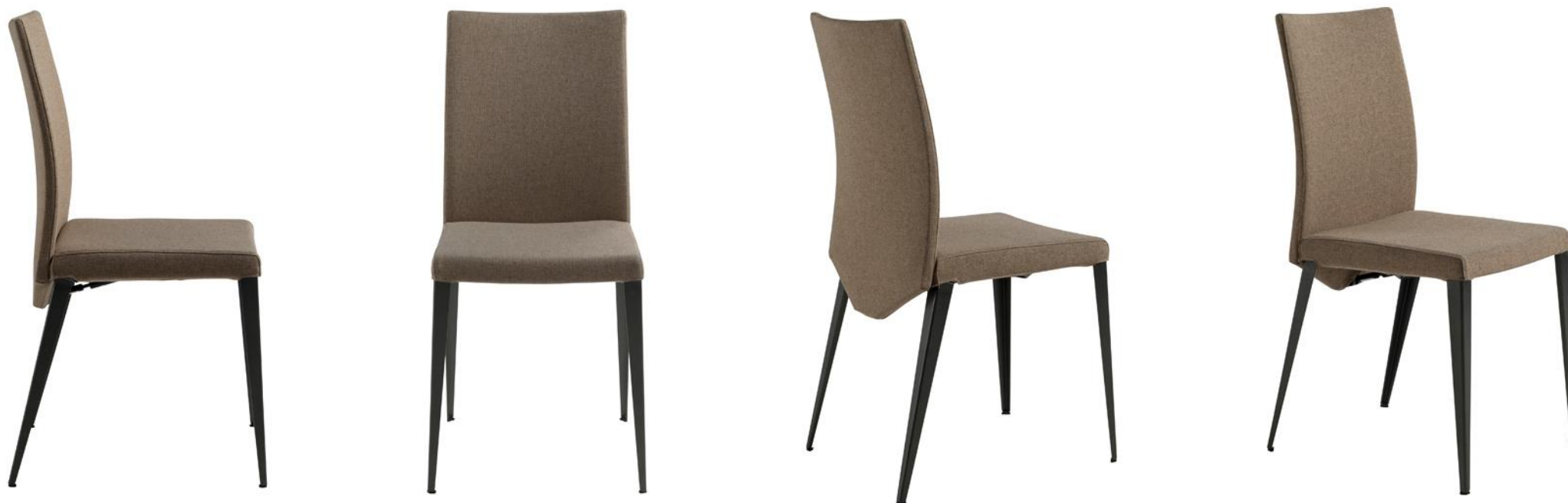
Chaise - Chair - Silla