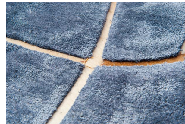
détails – details – detalles