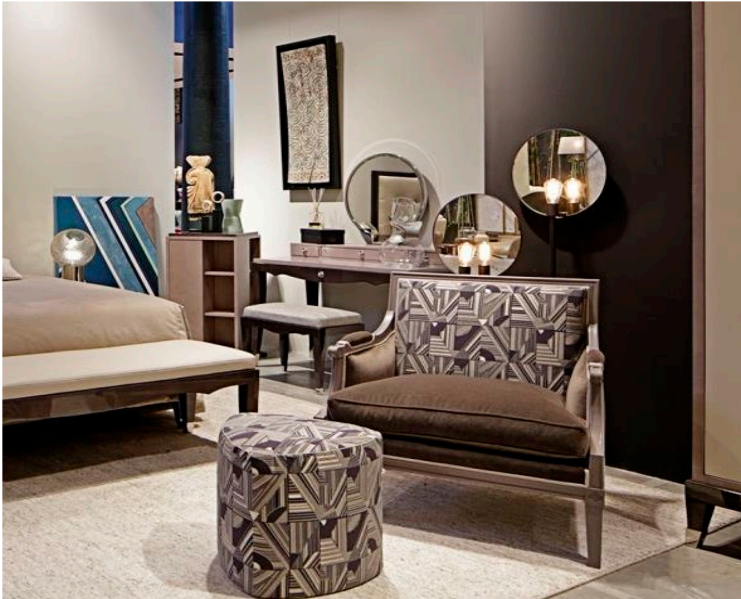
Marquise – Marquise Armchair – Marquise Sillon