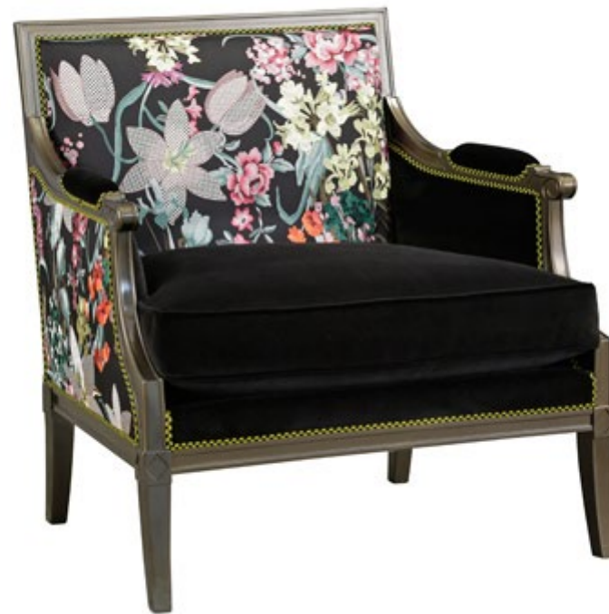
Marquise – Marquise Armchair – Marquise Sillon